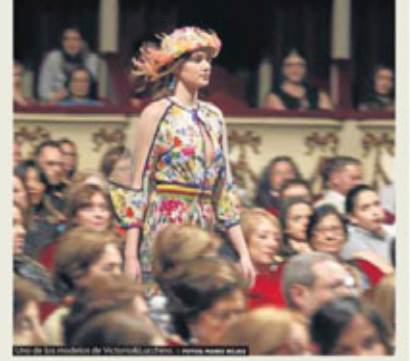
Una creación de Ángel Fernández