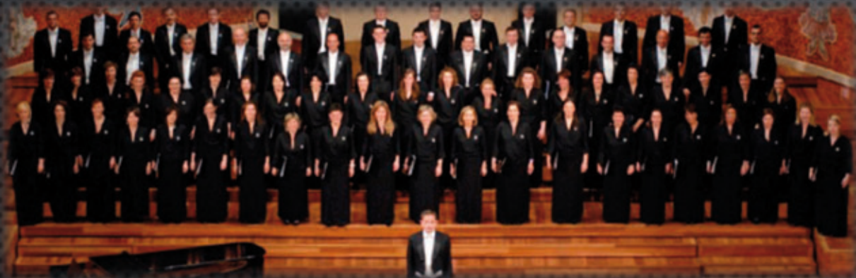
Coro Fundación Princesa de Asturias.