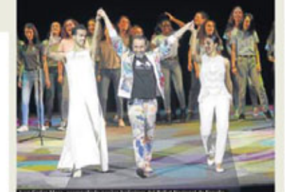
Los modelos de la colección de Ángel Fernández, parte de la propuesta de moda de Ángel Fernández...