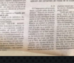
El evento presentará un show total que la segunda edición del certamen de moda de la ciudad