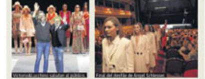
Una creación de Ángel Fernández