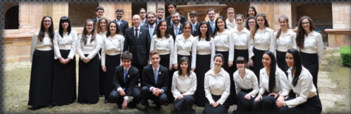
Joven coro Fundación Princesa de Asturias.