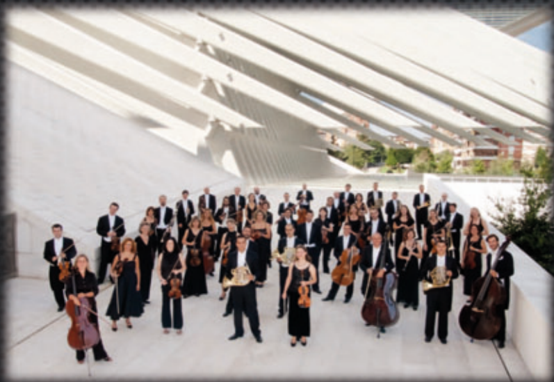
Instrumentos Oviedo Filarmonía.